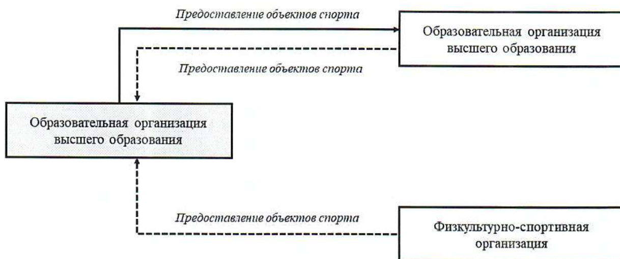
Рис. 1. Механизм коллективного использования объектов спорта

В рамках коллективного использования объектов спорта образовательная организация может осуществлять взаимодействие с иной образовательной организацией и (или) физкультурно-спортивной организацией, которая имеет возможность предоставлять объекты спорта в коллективное использование, для организации занятий физической культурой и спортом обучающимися.