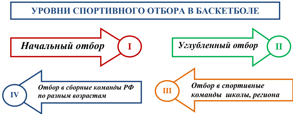
Рисунок – 1 Уровни спортивного отбора игроков в баскетболе

В баскетболе выделяют следующие уровни спортивного отбора (рисунок 1):